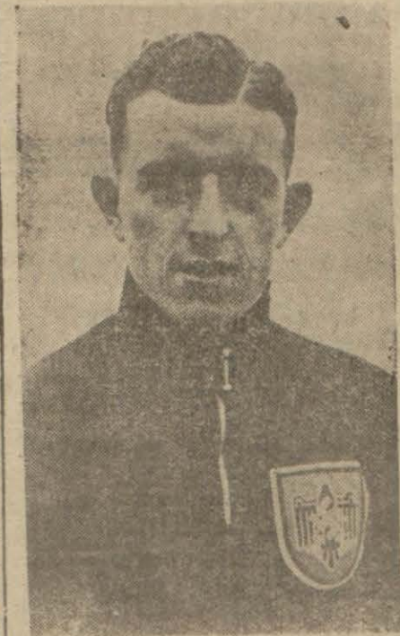
Admiranın 15 defa beynelmüllemiş bir oyuncusu Gauchel

İlk maç Cumartesi günü Gala tasarıyla, ikinci maç Pazar günü Fenerle yapılacak