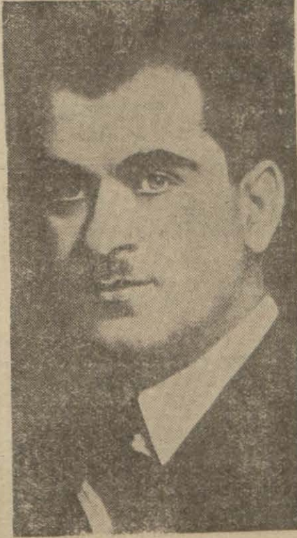
Maarif Vekilli Hasan Âli Yücel

duğu şu yıllarda, pek az millete nasib olan bir mükemmeliyette bulunduğu ve müzakere edilecek olan dünyayı umumiye bütçesinin de, bu küll içinde bunu teyid-